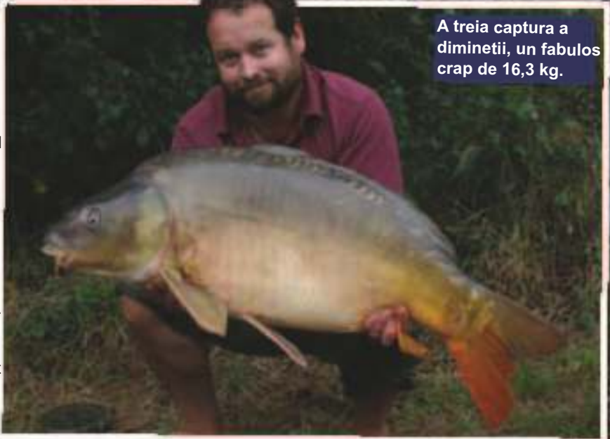
A treia captura a diminetii, un fabulos crap de 16,3 kg.

In seara aceea, in timp ce stateam pe marginea patului, ascultand din nou sunetele facute de sariturile pestilor, am fost alertat de ceea ce parea sa fie o trasatura pe lanseta din stanga, si am alergat spre lansete doar ca sa vad hangerul cum se aseaza la loc - era doar un peste care imi agatase violent firul. Stateam langa lansete cand dintr-o data lanseta din dreapta