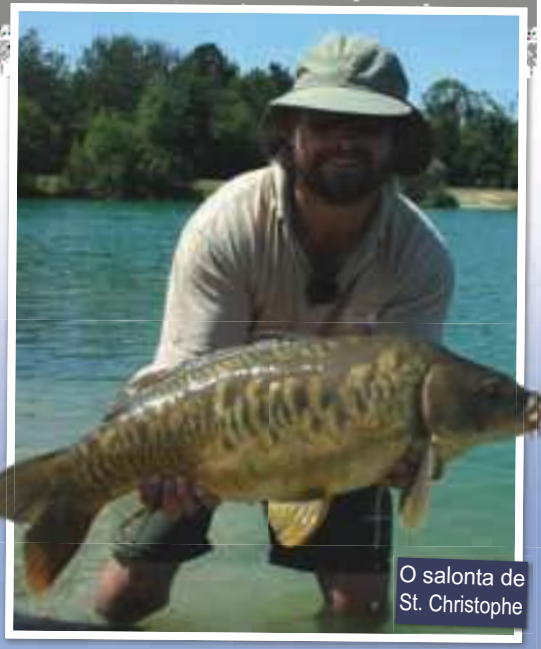
O salonta de St. Christophe

Chiar inainte de trasatura, pestii pe care ii vazusem facand valuri mai devreme in spatele balizelor incepusera sa se miste incet inspre mine, pana cand au inceput sa isi semnaleze prezenta exact deasupra nadei mele. Era un lucru extraordinar si am reusit sa mai prind inca doi crapi din acel loc, inainte ca pestii sa paraseasca zona. Cred ca cel mai probabil au mancat toata nada, dar am lasat vadul sa se odihneasca pentru cateva ore in cazul in care unul sau doi pesti singuratici ar mai fi fost prin zona.