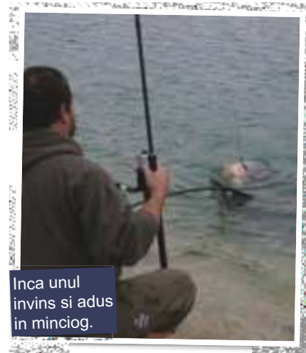
Inca unul invins si adus in minciog.