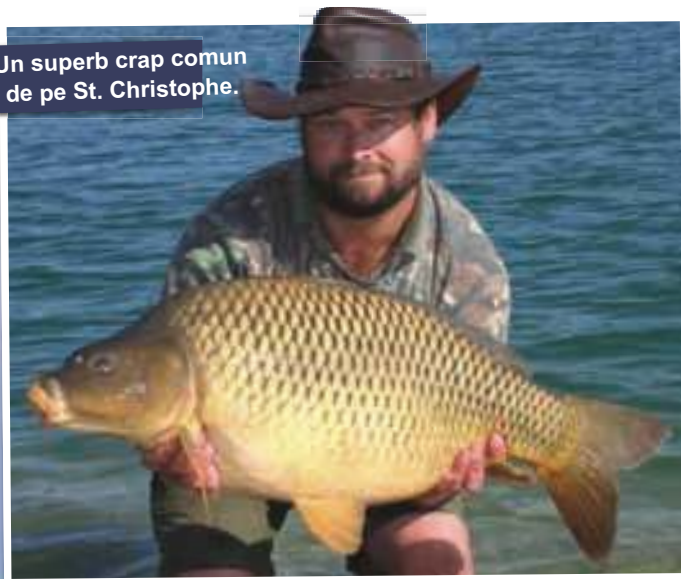
Un superb crap comun de pe St. Christophe.

Cu markerul scos din apa am inceput sa fac primele aruncari, asezand cele 4 monturi la distante diferite in zona nadita si folosind prezentari diferite pentru fiecare lanseta. Cu patul de nada facut si capcanele pregatite, m-am asezat relaxat pe scaun. Vremea era frumoasa si nu avea nici un rost sa ne grabim cu instalatul cortului.