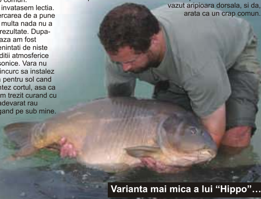
Varianta mai mica a lui "Hippo"...

vazut aripiora dorsala, si da, arata ca un crap comun.