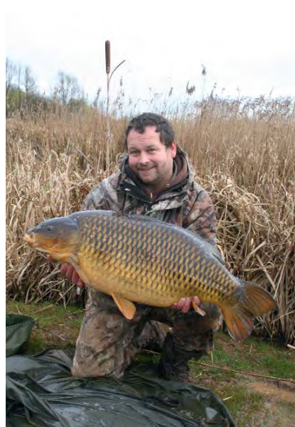
Crap comun mare de apa rece